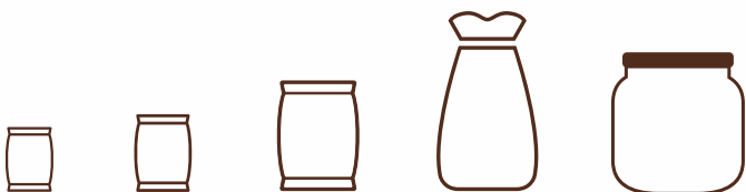
Bolsas 90-140 g

Nuestros productos recién tostados mantienen la calidad y todo el aroma.